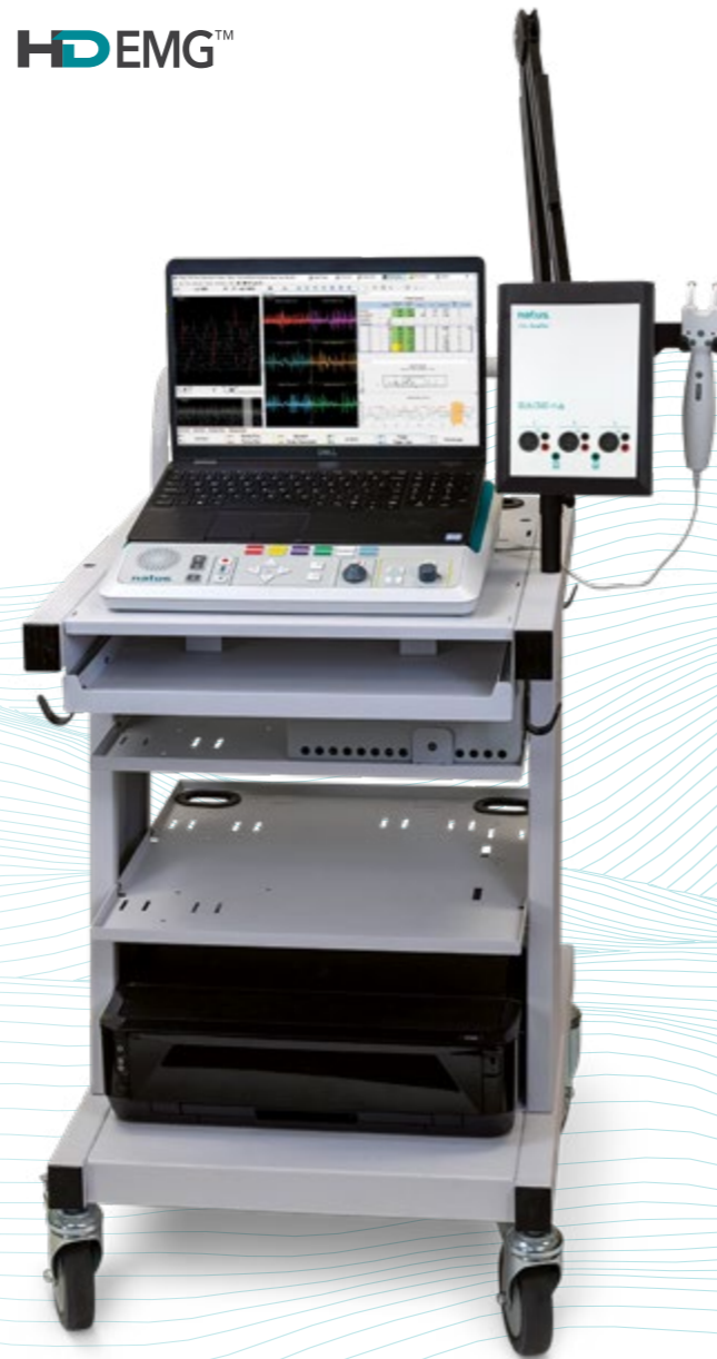
Elektrische Stimulatorsonde (optional erhältlich)