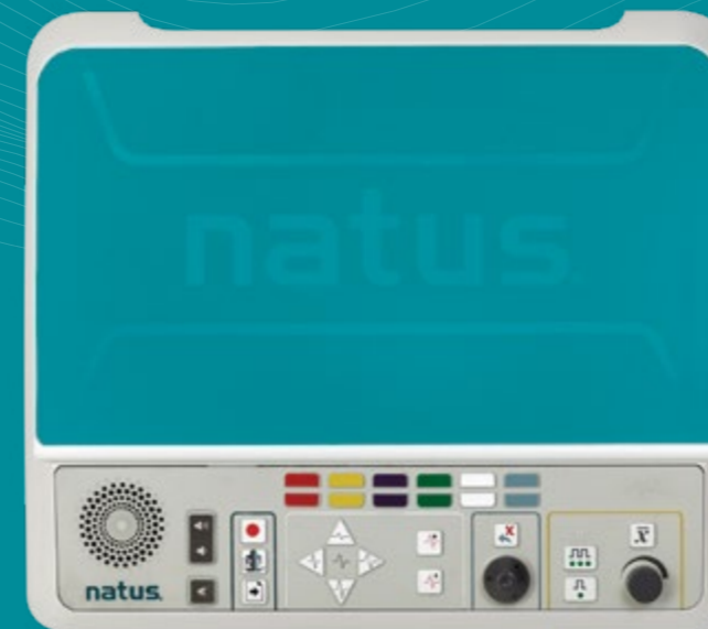
Bedienerfreundliche, farbcodierte Bedienelemente